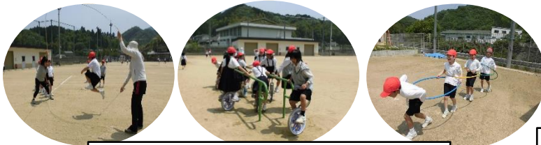
休み時間の遊びにも広がりが見られます。