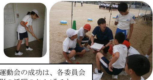
運動会の成功は、各委員会の影の活躍のおかげです。